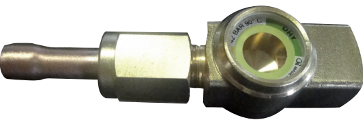
mod. KIT RACCORDO IN RAME / ACCIAIO